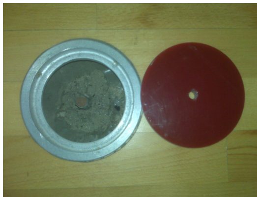
Vista del aro con la tapa.

Posteriormente se realiza un torneado al agujero practicado con una fresadora para embutir el aro metálico que alojará la tapa, para que todo quede a ras del suelo.