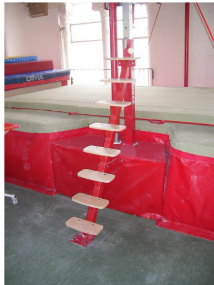
Foto 6: Detalle del soporte elevado para las bases de los aparatos.

También estudiamos otro tipo de fosos elevados especiales, como de cubos, ¡CONSÚLTENOS!: