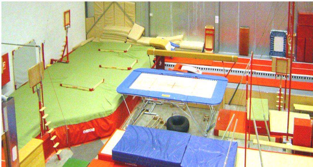
Foto.3. Vista de un foso elevado sin pasillo pero con podio elevado para salto y tumbling y con utilización de un trampolín normal (no encastrado).

REF a 7097: Foso elevado (“tipo Bolsa”) SIN pasillo de madera y podio opcional.