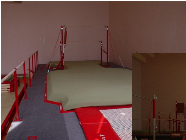
Foto 1. Vista del pasillo desde arriba

REF a 7099: Foso elevado con podio incorporado y pasillo de madera.