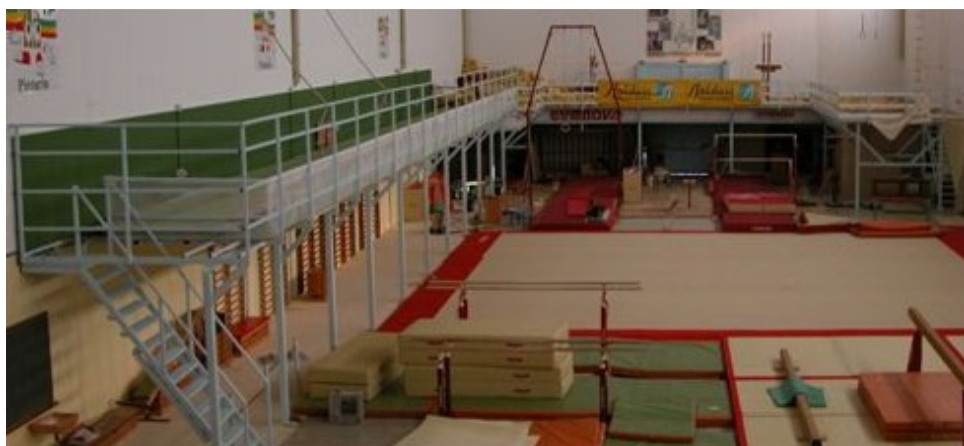
Foto 7: Foso elevado especial de cubos - Centro Arturo Toscano (Sevilla)

También estudiamos otro tipo de fosos elevados especiales, como de cubos, ¡CONSÚLTENOS!: